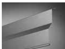
Lame en Z ZL