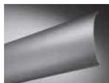
Lame bombée GL