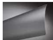
Lame plate FL