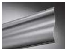
Lame ondulée DBL